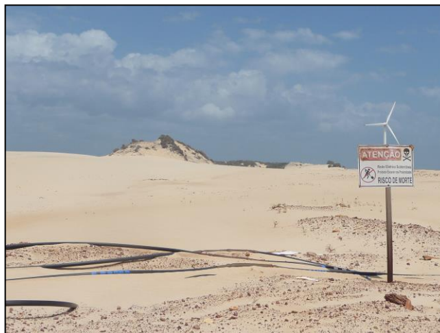
Figura 2: Limitações de acesso ao mar e aterramento das lagoas interdunares.

eletricidade, placas de limitação de acesso tem comprometido os espaços de lazer da comunidade.