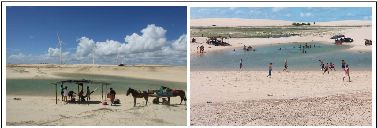
Figura 3 – Momentos de lazer nas dunas e lagoas interdunares.

Em decorrência da ausência de chuvas e das constantes proibições de acesso aos campos de dunas, os moradores afirmaram que a cerca de 5 anos não estavam mais usufruindo das lagoas interdunares, entretanto, no início do ano de 2017 o estado do Ceará apresentou um volume significativo de chuvas, contribuindo para que os moradores da comunidade voltassem a desfrutar desse recurso natural como espaço de lazer, como se observa na figura 3.